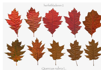
Blad van Amerikaanse eik

In Laag Hees staan veel loof- en naaldbomen. Tegenwoordig wordt geprobeerd om exotische bomen, zoals de Amerikaanse eik, te verwijderen. Een exoot is een buitenlandse plant of boom die hier eigenlijk niet hoort. Soms wordt er bewust voor gekozen deze exoten weg te halen om inheemse bomen - die er wel horen - meer ruimte te geven. In Laag Hees zijn inheemse bomen bijvoorbeeld de eik, beuk, berk, els en grove den. Een keer eerder werd de Amerikaanse eik al weggezaagd maar de stronken zijn weer gaan groeien. Jullie gaan dus opnieuw deze boom tot de grond afzagen.